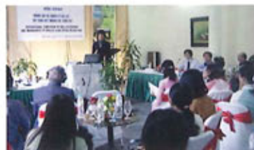
東南アジア地域での外来種問題国際会議と知識の普及