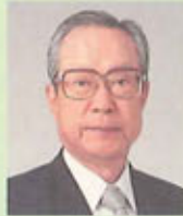
財団法人 国際花と緑の博覧会記念協会会長