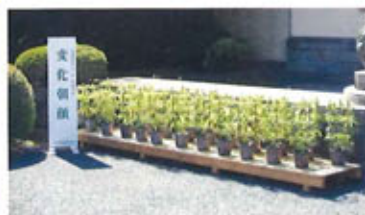
「庭園植物記」展とその関連事業