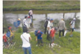
自然環境保全事業