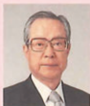
財団法人国際花と緑の博覧会記念協会会長