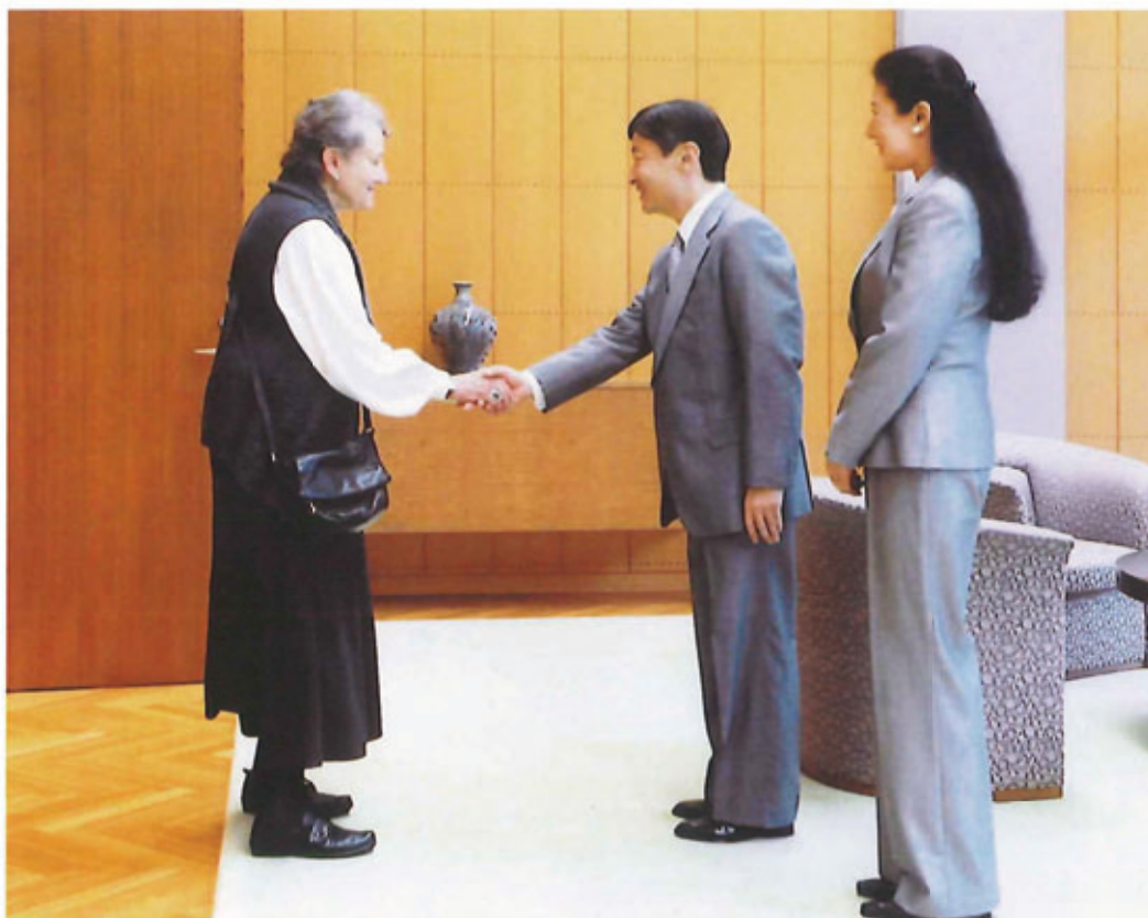
コスモス国際賞受賞者エステラ・B、レオポルド博士は、皇太子同妃両殿下とお会いになった。 (平成22年10月12日 東宮御所にて)