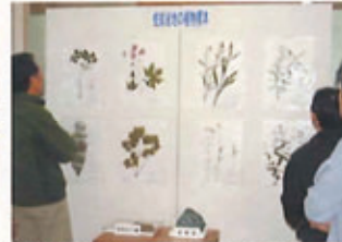
旭川市蛇紋岩地帯の植物の調査研究