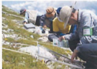
中央アルプス高山植生の長期モニタリング