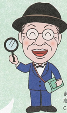
まきのさん

日本の植物相を解明しようと『日本植物志図篇』(1888-1891年)や『大日本植物志』(1900-1911年)などを出版し、博士の代表作『牧野日本植物図鑑』(1940年)は、現在まで改訂を重ね、植物図鑑として広く親しまれています。