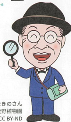
まきのさん 高知県立牧野植物園 CC BY-ND