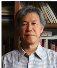
丸山 宏 氏

1989年3月北海道大学大学院環境科学研究科修士課程修了、同年4月建設省(当時)入省、国土交通省北陸地方整備局国営越後丘陵公園工事事務所長、近畿地方整備局建設部公園調整官、大津市副市長、国土交通省関東地方整備局国営昭和記念公園事務所長、近畿地方整備局建設部長、都市局参事官(国際園芸博覧会担当)を歴任し、2022年6月より現職。