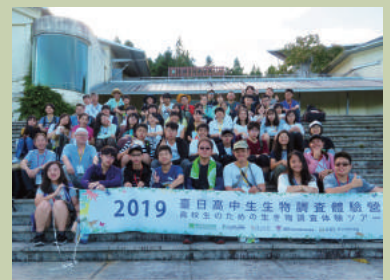
参加者同士の交流