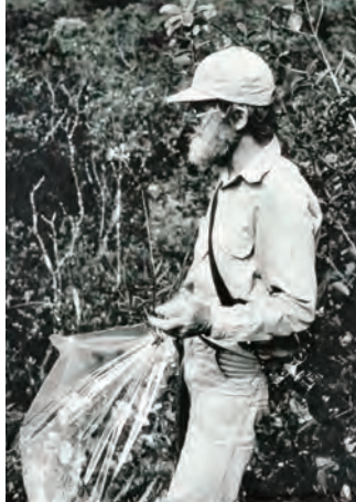
Serra do Aracá州立公園で植物標本を集めるプランス博士。1985年。

ギリアン・プランス博士は、南米のアマゾン川流域で、三十年以上にわたり調査を実施。三万点以上の植物の資料標本を収集し、四百五十種以上の新種を発見しました。