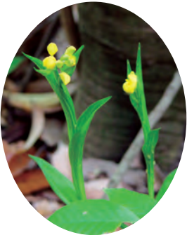
樹木・菌根菌と共生する希少種のキンランが発生。