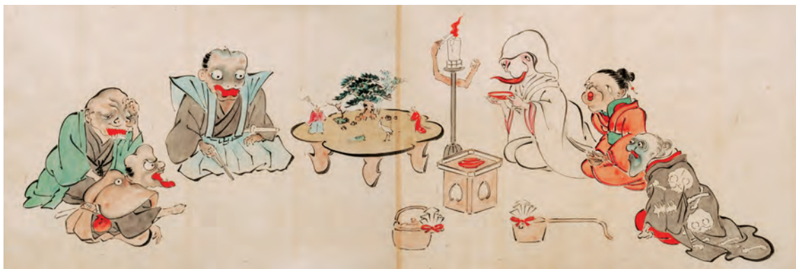
『化物婚礼絵巻』(国際日本文化研究センター 所蔵) 江戸後期に描かれたとみられる。中央の嶋臺には、松、鶴などのほかに人間の尉(じょう)と姥(うば)が飾られている。化物の世界の描写にも、婚礼の場面となれば嶋臺が描かれることから、嶋臺は婚礼につきものの道具であったことがわかる。

日本の花見には、飲食がかならず伴っています。春が来て、めでたいからごちそうを用意するのではありません。神さまに捧げているのです。(十一ページコラム参照)