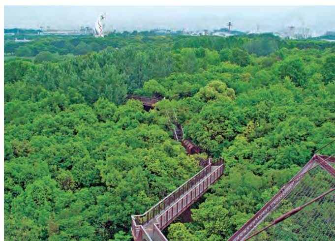
2000年、見かけは森が成立したので、上から観察する樹冠回廊「ソラド」が作られた。

の絶滅危惧種のレフュージア(避難場所)としての機能が期待されます。 風倒木が導く「自立した森」 オオタカも営巣したこの森。でも、里山森林では最も個体数の多い哺乳類のアカネズミが、やっとなてくれたのは五年ほど前。里山では谷筋によく見るリョウメンシダやイノデというシダは、排水改良のために掘った深い溝の壁にしか、ほぼ見られませんが、痩せ山ならどこにもあるコシダは見当たらないし、ウラボシも一か所だけ。