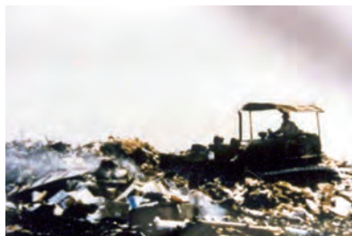
上/現在の花博記念公園鶴見緑地。訪れた人々が思い思いの時間をすごしている。 左/1990年に開催された国際花と緑の博覧会の空撮写真。 右/かつてはレンコンやクワイが育つ湿地だった鶴見緑地。(右上)1960年代以降、家庭ごみや地下鉄工事のさいの残土で埋め立てられた。(右下)

白幡 ●明治政府の掲げた公園づくりの目標は、利用者の用途を考え、喜びの場を提供することよりも、洋風を売りに人を引きつけて、とにかく入場数を増やすこと。利用者の要望を聞く余裕も姿勢も弱かった。これではあかんやろ、従来の公園の概念から脱皮しよう、そういう意図で、「公園なんてもういらぬ」という原稿を書いたことがあるんですよ。その結果かどうか、ひと