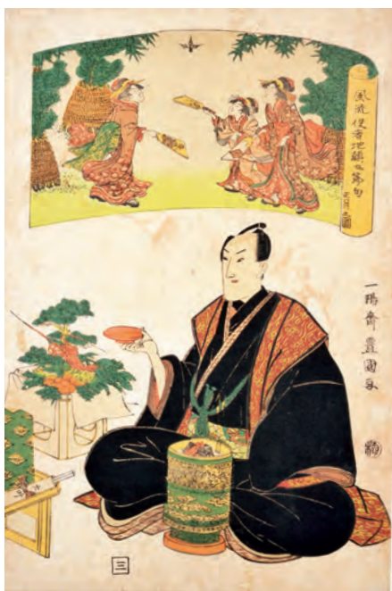
「初代豊国錦絵帖」『風流役者地顔五節句 正月之図』 左奥が食積。三方の上にマツやイセエビが載っている。 江戸後期の正月の風景を初代歌川豊国が描いた図。