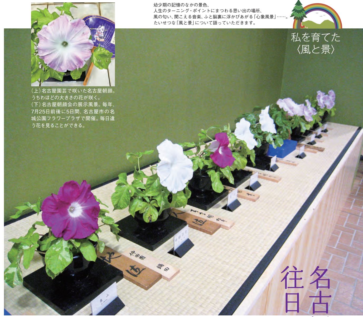
(上)名古屋園芸で咲いた名古屋朝顔。 うちわほどの大きさの花が咲く。 (下)名古屋朝顔会の展示風景。毎年、 7月25日前後に5日間、名古屋市の名 城公園フラワープラザで開催。毎日違 う花を見ることができる。

幼少期の記憶のなかの景色、 人生のターニング・ポイントにまつわる思い出の場所、 風の匂い、聞こえる音楽、ふと脳裏に浮かびあがる「心象風景」……。 たいせつな「風と景」について語っていただきます。