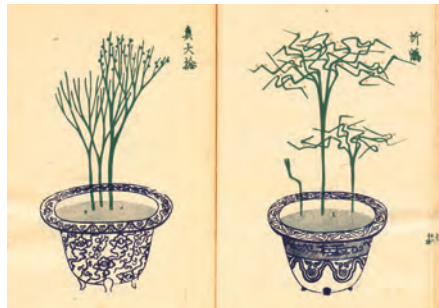
1836年に出版された『松葉蘭譜』。松葉蘭の姿と専用の「松葉蘭鉢」が、木版画で繊細に描かれている。鉢には、高度な技術で絵付けや装飾がほどこされていた。いまでは再現できない技術もあるという。

松葉蘭は江戸時代末期に全盛を極めました。が、明治維新の政変によって大名や富豪が没落すると、栽培地が放棄され、多くの名品が失われました。けれどもそれから半世紀のち、