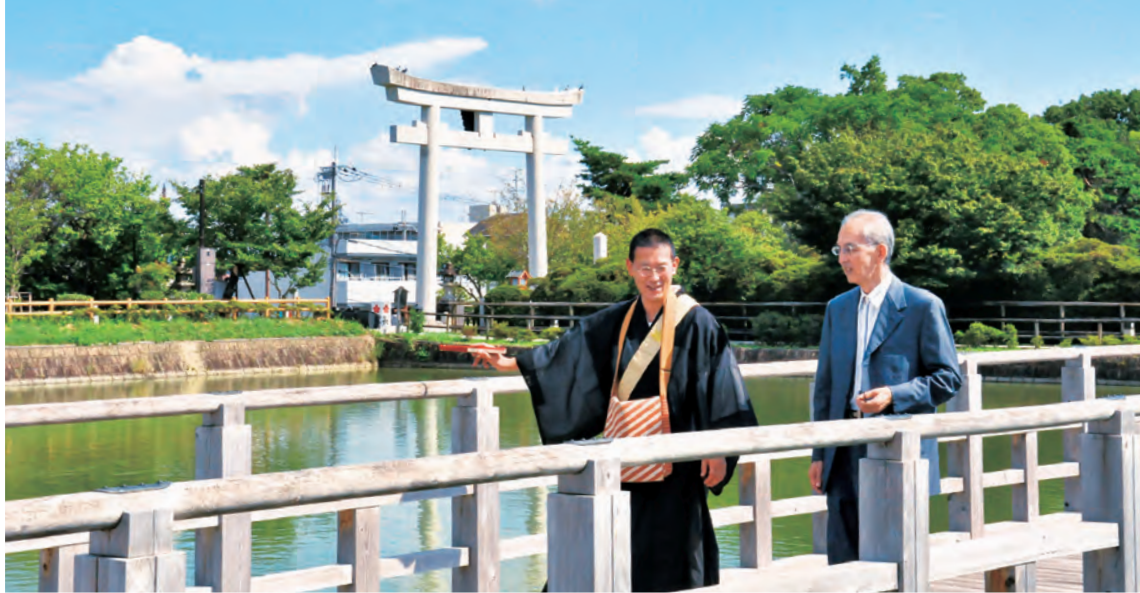
八条が池は、1638年に当時の領主である八条宮が命じて造営された灌漑用のため池。外周は約1キロメートル。奥に見えるのが、長岡天満宮の正面大鳥居。