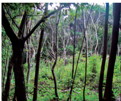
人工ギャップを作った翌年のようす。次世代が芽生え、若木が成長する。手前や奥は過密単層の「モヤシ林」。