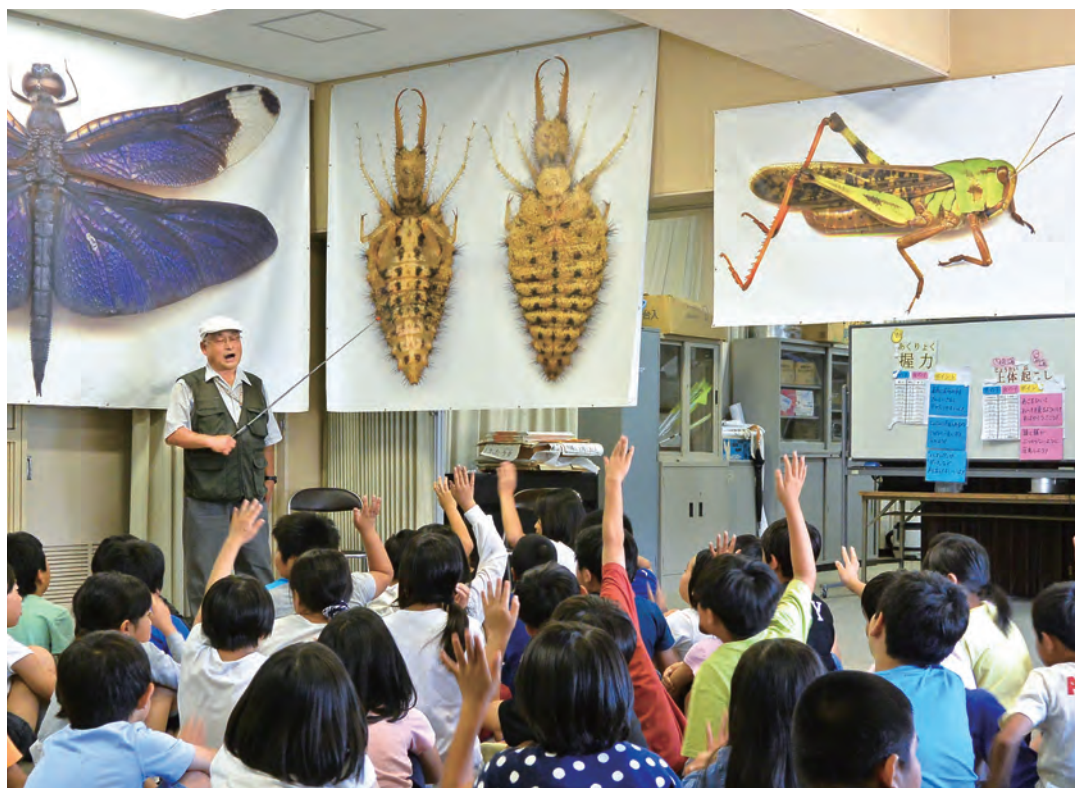
アリジゴクの昆虫大写真を例に昆虫の体の構造を紹介

花博記念協会は、「自然と人間との共生」という理念の継承・発展の一環として、協会とゆかりのある科学者や知識人を小学校に派遣し、四十五〜九十分の授業を担当します。派遣の対象は大阪府内および近郊の小学校の児童。「植物のはたらき」、「昆虫の生態・川の環境」、「まちの景観・歴史」、「動物の命」の四つのカテゴリごとのエキスパートが、自然と人間との関わりや生きものの生態、いのちの大切さを、身近な話題を織り交ぜながら語りかけます。