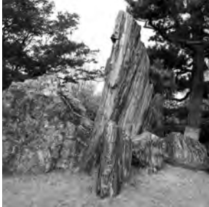
右／築山の中心部に組まれた豪快な蓬莱石組。 下／中心の蓬莱石組から東部の集合住宅を望む。

しげもり、みつあき●一九六五年、京都市に生まれる。京都芸術短期大学専攻科修了。バリ国立高等美術学校卒業。二〇〇六年重森三玲旧邸の書院庭園部を「重森三玲庭園美術館」として再生、館長に就任。現代アートを制作・研究してきたが、近年は伝統芸術にも関心をよせる。著書に『重森三玲 II』がある。庭園の設計にも取り組み、現代庭園の創作を模索する。三玲は祖父。