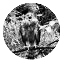
万博の森で生まれたオオタカの幼鳥。2010年7月。