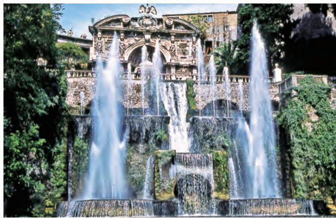
16世紀なかばにイタリア・ローマ郊外のティヴォリに建てられたエステ家別荘。2001年にユネスコの世界遺産に登録。水、噴水は花とならんで西洋の庭園における重要な要素。

長尾 ●寺の庭は、浄土の世界の雰囲気を出したり、禅宗なら修行の場としてつくられていたり