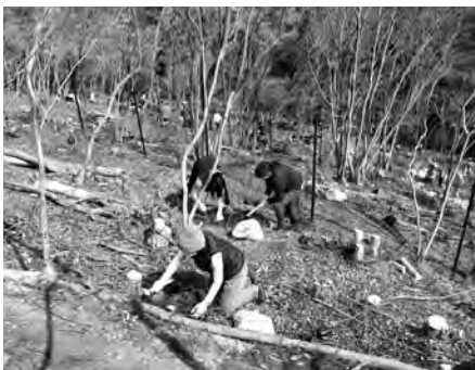
右／桂川にかかる渡月橋近辺から望む小倉山。手前に流れるのは桂川。 下／2016年の植樹の様子。発足してから三度目の植樹祭。そのほか、月に一度はメンバーが山に入り、不要木の除伐などの林床整理を行なう。