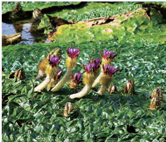
葉を突き破り開花する開放花。

オニバス スイレン科オニバス属 学名 Euryale ferox 和名 オニバス(鬼蓮) 原産地 本州、四国、九州、アジア東部、インド 開花期 8月から9月 環境省レッドリスト 絶滅危惧II類(VU)