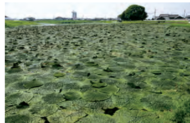
兵庫県稲美町で撮影。

*学会や展示会などへの動画(DVD)の貸し出しもしています。 http://www.expo-cosmos.or.jp/