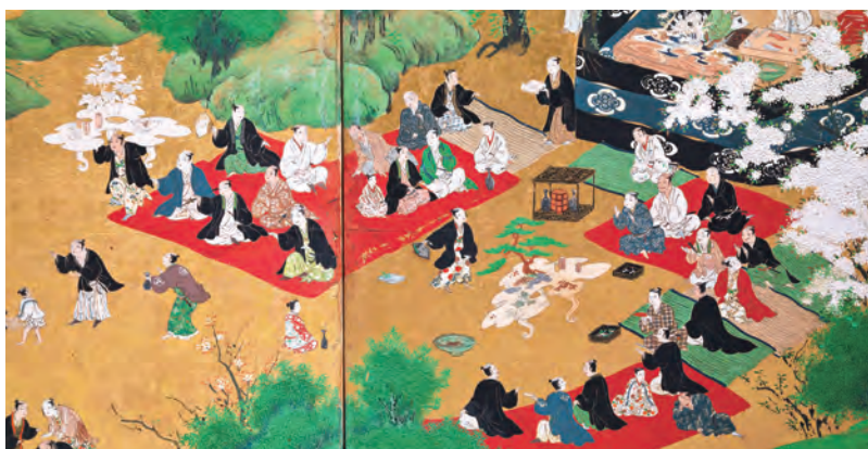
「東山遊楽図屏風」(メトロポリタン美術館 所蔵)

狩野派の絵師によるものとみられる。2メートル70センチの屏風には、京都の東山地区で春を過ごす約300人の姿が描かれている。抜粋したのは、花見を楽しむ集団。鳴臺を屋外にもちだし、担いだり(左上)、周りで踊ったり(中央)している。春の楽しさを体で表現しているようだ。