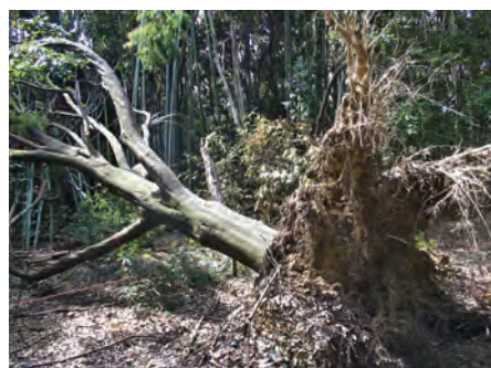
昨年の台風でエノキが根返り倒木。ギャップ・ダイナミクスの環境学習の貴重な機会となる。

また、森の中には丘陵地の湧水湿地環境も新たに造成されました。例えば新たに絶滅危惧種のイシモチソウやトキソウなどの湿生植物や、両生類のカスミサンショウウオなどにも来て欲しいですね。それだけではなく、この「キジの原野」はオオタカが小動物や小鳥を採餌する開けた環境としても役立つかもしれません。里山ではシカ食害で絶滅の危機に瀕する植物も多いなか、万博の森は大阪