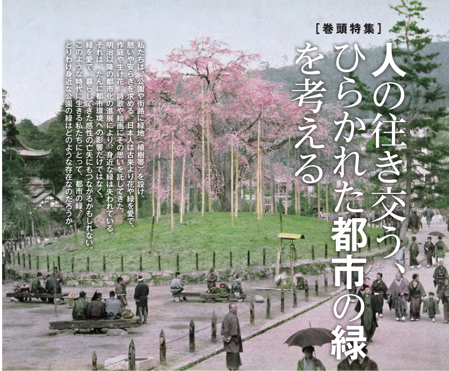
京都の円山公園のしだれ桜 明治初期～中期ごろの写真。円山公園(京都市)は1886年に開園。そののち、整備と改修が行なわれ、1913年の小川治兵衛(植治)の改良工事をへて、現在の姿となった。