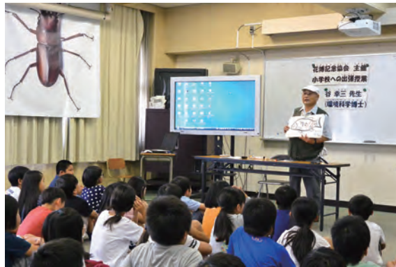
手づくりの資料なども活用し、環境と生きもののかかわりを紹介

専門とするトンボの話になると、「谷節」はさらにヒートアップ。細長い腹部を示し、「トンボはなんと十段階。虫眼鏡でじっくり観察してみると、十の節に分かれていることがわかります。交尾のようすを見たことはありますか。腹部を丸めてメスとオスが