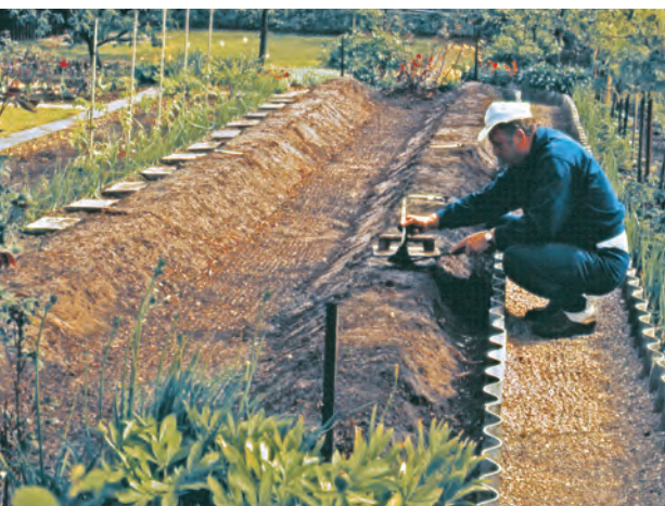
ドイツのクラインガルデン。アスパラガスを植えている。