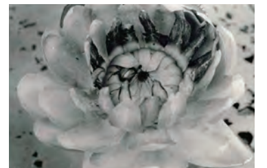
オオオニバスは閉じた花の中に甲虫を閉じこめる。花の中は周囲よりも10度ほど温度が高く、偽柱頭は食べものになるので、甲虫にとっては快適な環境である。花が開くと、花粉とともに甲虫が飛び立ち、べつの花に花粉を運ぶ。

ます。一九九〇年ころから計画がはじまり、二〇〇〇年にオープンしました。百五十以上の国々から種子が送られてくる国際的な施設で、世界の植物種の約十二パーセントにあたる八万七千種以上の種子を保存している林しました。