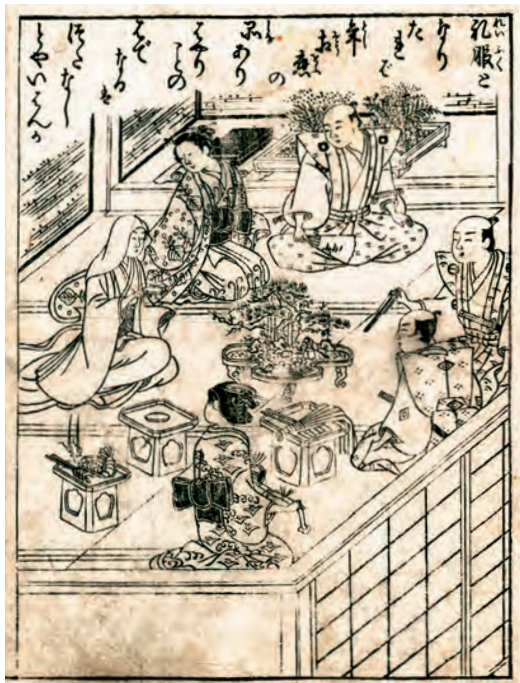
石川豊信筆『絵本江戸紫』(1765年)(国立国会図書館 所蔵) 婿、嫁、両親などが囲む婚礼の場面の真ん中に嶋臺が描かれている。松の木に竹、梅、人形などの飾り物を配している。奥の床の間には盆石らしきものも見える。